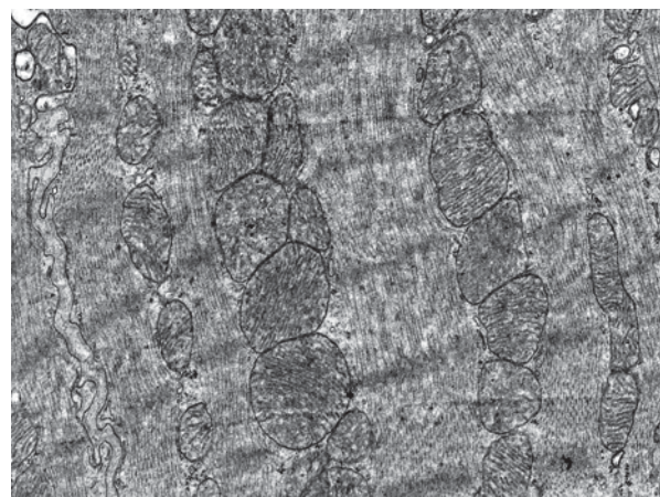
Рисунок 4 – Ацетаминофен и Тауцинк. Митохондрии преимущественно овальной формы с умеренно-плотным матриксом. Ув. X 20 000