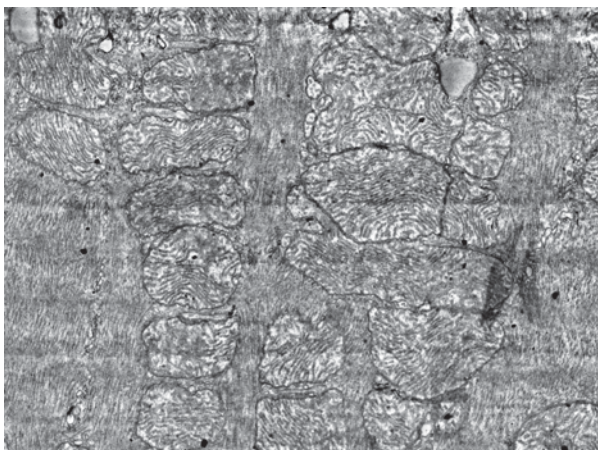
Рисунок 2 – Ацетаминофен. Набухшие митохондрии с волнистыми очертаниями наружных мембран. Ув. X 20 000