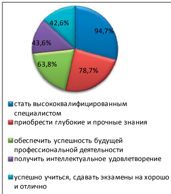
Рисунок 1. – Ранг мотивов (студенты 1-го курса)