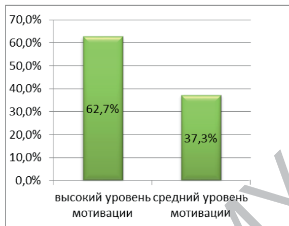
Рисунок 4. – Внутренняя мотивация студентов 2-го курса

часто бывает такое состояние, когда «совсем не хочется учиться» (19 чел. – 20,2%).