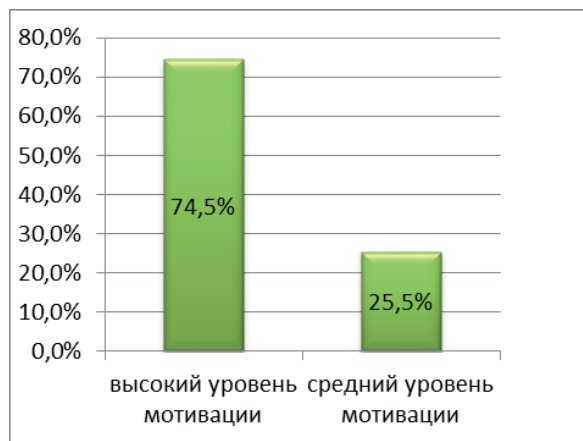
Рисунок 3. – Внутренняя мотивация студентов 1-го курса