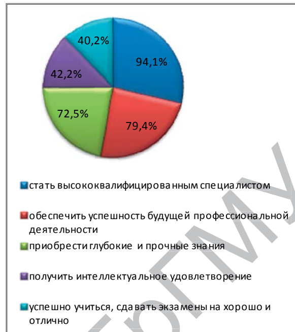
Рисунок 2. – Ранг мотивов (студенты 2-го курса)

№ 1 – стать высококвалифицированным специалистом, II место – мотив № 10 – обеспечить успешность будущей профессиональной деятельности; III место – мотив № 6 – приобрести глубокие и прочные знания; IV место – мотив № 16 – получить интеллектуальное удовлетворение; V место – мотив № 4 – успешно учиться, сдавать экзамены на «хорошо» и «отлично». Из диаграмм видно, что студентами как 1-го, так и 2-го курсов выбирались мотивы познавательные и профессиональные.