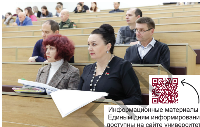
Информационные материалы к Единым дням информирования доступны на сайте университета

Рост и усложнение методов киберугроз требуют опережающего и комплексного реагирования. В Беларуси принят ряд системных мер, и борьба с киберугрозами ведется на нескольких уровнях. Так, на государственном уровне Указом Президента Республики Беларусь № 40 «О кибербезопасности» реализуется комплексный многоуровневый механизм противодействия кибератакам на государственные органы и организации, критическую информационную инфраструктуру. Создан Национальный центр обеспечения кибербезопасности и реагирования на киберинциденты. Налажено международное сотрудничество в этой сфере.