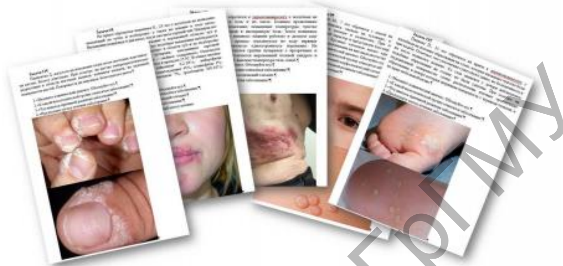
Рисунок – Примеры задач

который должен быть четко сформулирован или аргументирован. Кроме этого, учитывается активность работы студента при дополнении ответов на другие кейсы.