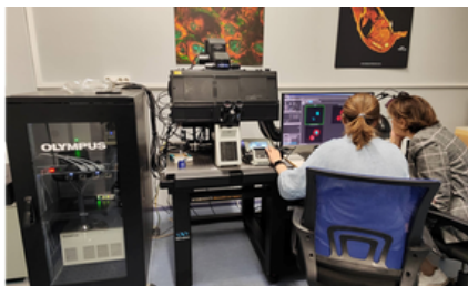
Конфокальный лазерный сканирующий микроскоп