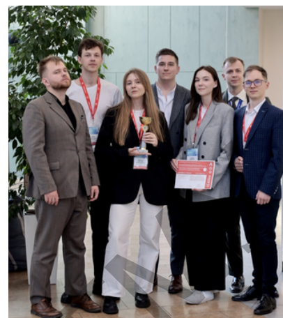
Олимпиада по кардиологии

Они решали видео-задачи и текстовые кейсы, достойно отвечали на каверзные вопросы модераторов и были награждены памятными призами за проявленные профессионализм и креатив.