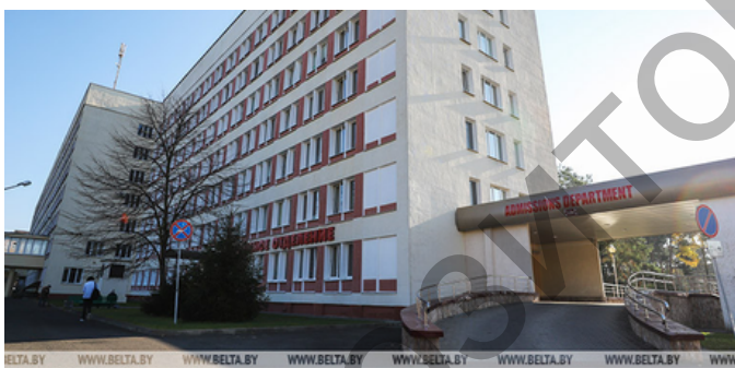
Брестская областная клиническая больница

Факультет повышения квалификации и переподготовки в целях расширения сферы образовательных услуг инициировал открытие филиалов кафедр университета в региональных учреждениях здравоохранения: