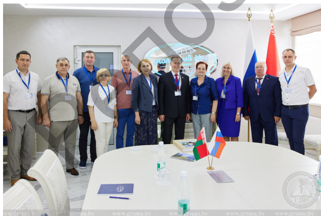
IX Форум регионов Беларуси и России

Не остается в стороне и многолетнее сотрудничество с вузами Российской Федерации. Неоднократно делегации из университетов России посещали наш университет. В свою очередь и представители Гродненского медуниверситета обмениваются опытом, ведут совместную работу с российскими коллегами и партнерами. Участвуют в трансграничных форумах и симпозиумах.