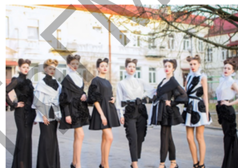
Театр моды «Совершенство»

Также на базе общежитий осуществляют свою деятельность любительские объединения. Для желающих узнать больше о белорусской национальной культуре и ремеслах отличным вариантом является коллектив «Белорусочка». Тем, кому интересен фито-дизайн, арт-дизайн и декор, подойдет любительское объединение «ДЕКОРИК». Любителям кулинарии университет предлагает объединение «Кухня народов мира». Здесь участники могут совершенствоваться