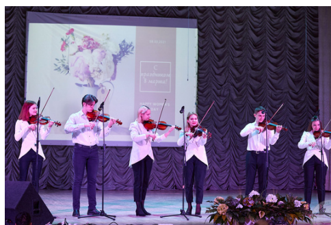
Ансамбль скрипачей "Квартет"

Для желающих проявить себя в актерском мастерстве, музыке, моделинге и танцах в нашем университете есть несколько кружков. Участники не остаются за кадром, у них есть возможность выступать на мероприятиях университетского и даже республиканского масштаба.