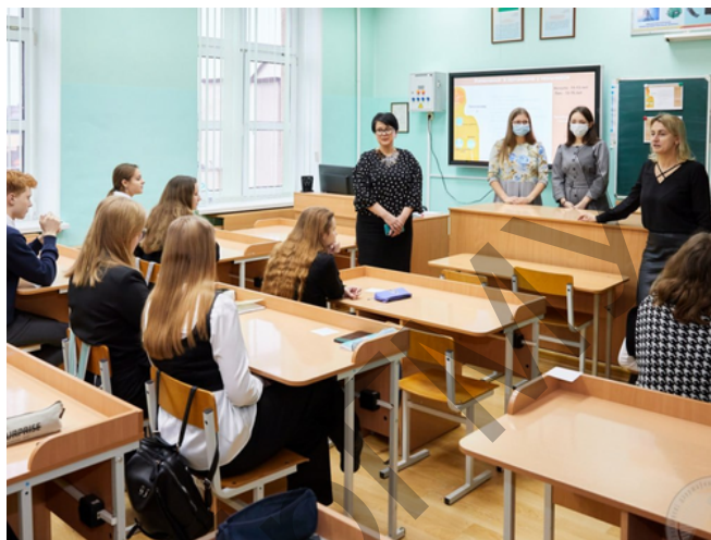
Наталья КОНОВОД Фото из архива

Помимо этого, свои практические навыки студенты совершенствуют во время занятий, которые проходят не только в учебных корпусах вуза, но и на базах больницы, поликлиник и других учреждений здравоохранения.