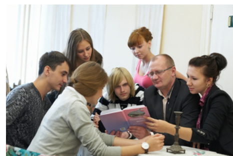
Литературный клуб "КАТАРСИС"

свое мастерство в приготовлении блюд разных стран. Более 20 лет в ГрГМУ существует литературный клуб «Катарсис», деятельность которого направлена на развитие и популяризацию литературного жанра, воспитание художественного вкуса и навыков. Все студенты, литературное слово которых требует внимания, с помощью объединения могут быть услышаны. Некоторые участники даже издают свои литературные сборники.