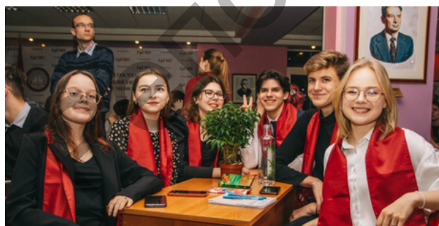
Интеллектуальная игра «ScienceQuiz»

Желающим заявить о себе и своих талантах ГрГМУ предлагает поучаствовать в ежегодных конкурсах «Королева студенчества», «Мистер университет», «Студент года».