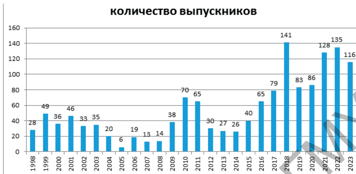
Рисунок 2. – Количество иностранных граждан, окончивших Гродненский государственный медицинский университет Figure 2. – Number of foreign graduates from the Grodno State Medical University