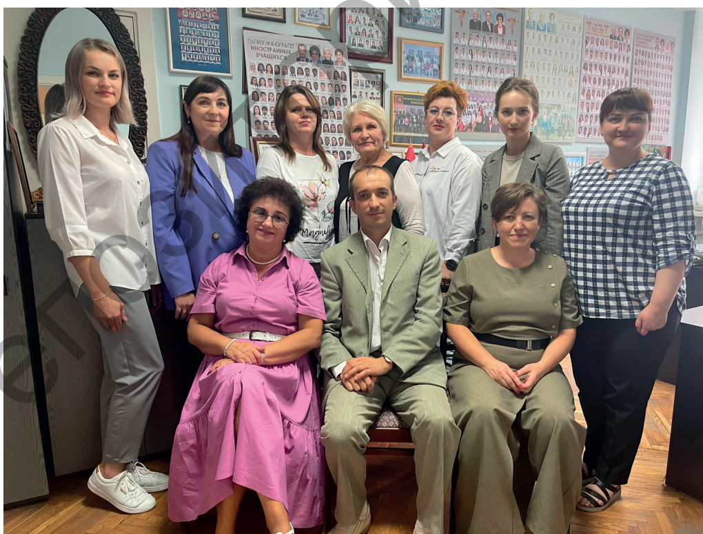
Фото 1. – Штатный состав деканата факультета иностранных учащихся. Гродно, 2023

Достигнутые значительные результаты университета и факультета нашли свое отражение в анкетировании выпускников. Так, если в 2017 г. минимальные оценки некоторых кафедр по качеству проведения практических занятий, чтению лекций, объективности оценки знаний, обеспеченностью литературой, материально-технической базой составляли 2,5 по пятибалльной шкале, то в 2022 г. этот показатель составил 4,7. Общая удовлетворенность всеми видами деятельности факультета и университета, условиями и обстановкой в стране составила 4,64 балла. При сравнении степени освоения практических навыков студентами также отмечено, что значительно снизилось количество манипуляций, на которых обучающиеся вообще не присутствовали (менее 5% опрошенных в настоящее время, при 15% в 2017 г.). Одновременно выросли ко-