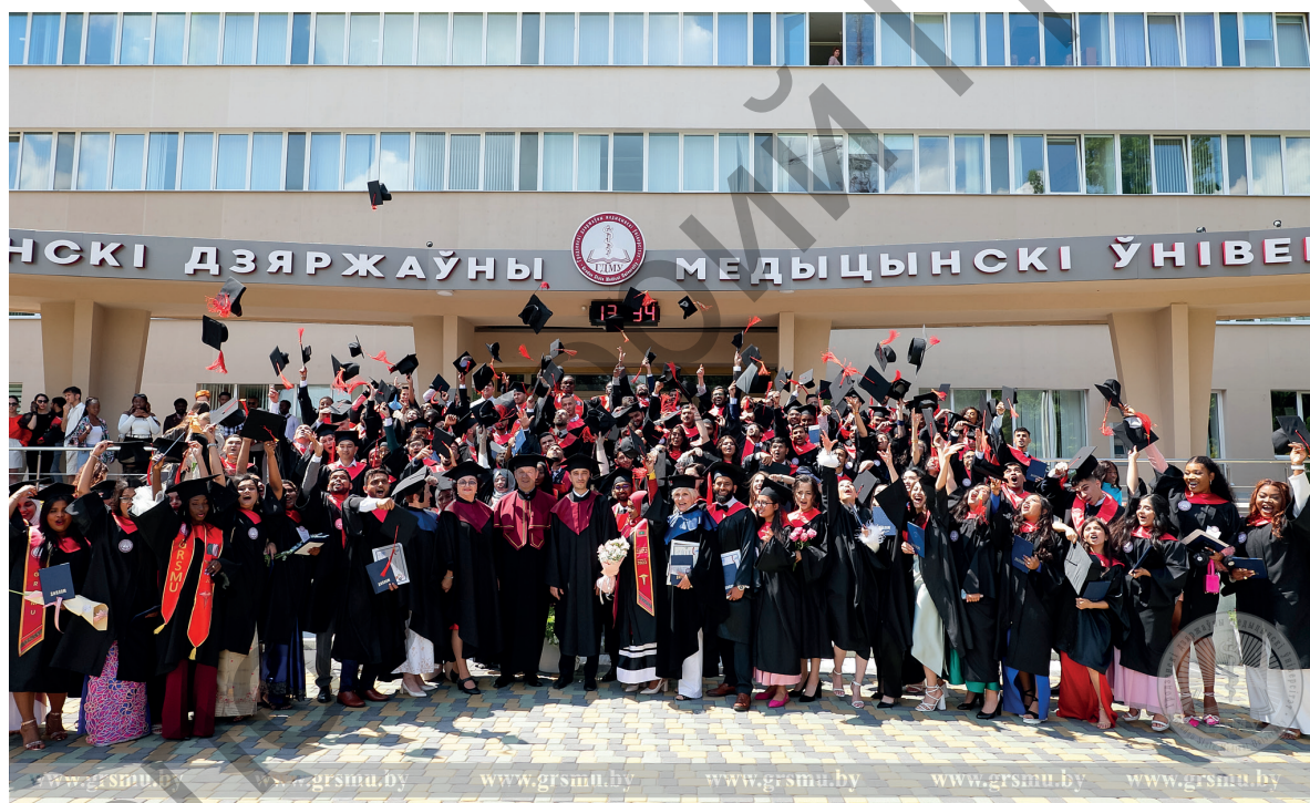
Фото 2. – Выпуск-2023 факультета иностранных учащихся, Гродно, 2023