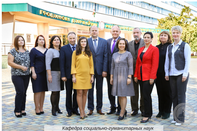
Кафедра социально-гуманитарных наук