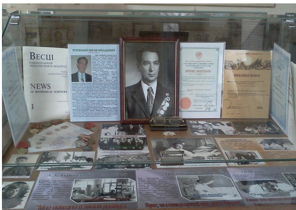
Экспозиция, посвящённая А.А. Туревскому, в Музее выдающихся евреев Гродненщины