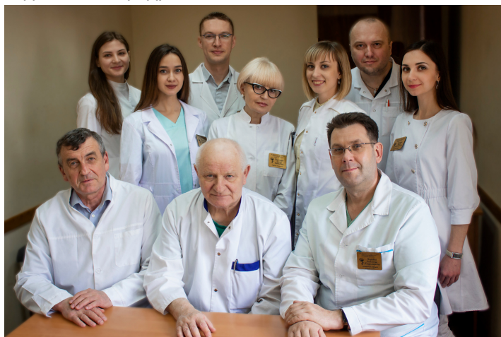
Профессорско-преподавательский состав кафедры онкологии

Преподавание онкологии в Гродненском медицинском институте осуществлялось с 1985 года на базе кафедры госпитальной хирургии. 5 марта 1993 года на основании Ученого Совета приказом ректора №24-Л-1 была организована самостоятельная кафедра онкологии. С 1998 года с целью оптимизации учебного процесса кафедра онкологии была объединена с кафедрой лучевой диагностики и лучевой терапии в единую кафедру. С 2011 года вновь произошло обособление дисциплин, каждая из которых стала преподаваться на отдельной кафедре.