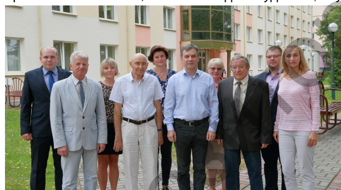
Коллектив кафедры неврологии и нейрохирургии, 2019