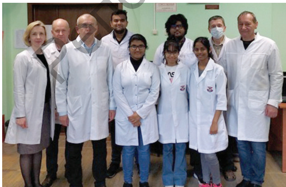
Призеры и финалисты олимпиады факультета иностранных учащихся с английским языком обучения