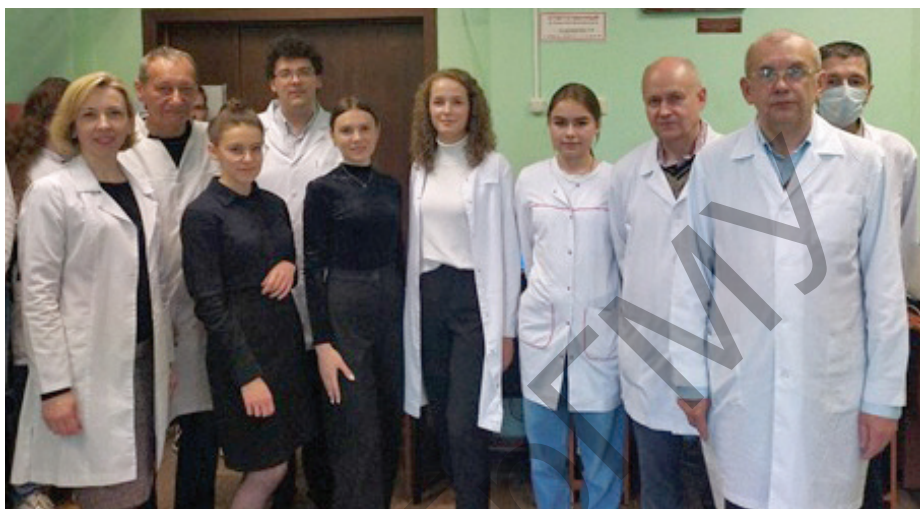
Призеры олимпиады среди студентов с русским языком обучения

го тура 61 студент с лучшим результатом принял участие в следующем этапе олимпиады. В финал вышли 14 студентов с русским языком обучения и 8 иностранных учащихся с английским языком обучения. Во время финального этапа олимпиады студенты продемонстрировали отличное знание материала, что подтверждается их высокими баллами. Средний результат финалистов олимпиады среди студентов лечебного, педиатрического, медико-психологического и медико-диагностического факультетов составил 89,3%, а лучшие результаты находились в диапазоне от 94 до 97 процентов правильных ответов. В то же время средний показатель финалистов факультета иностранных учащихся был немного ниже – 81%, а результаты призеров находились в диапазоне