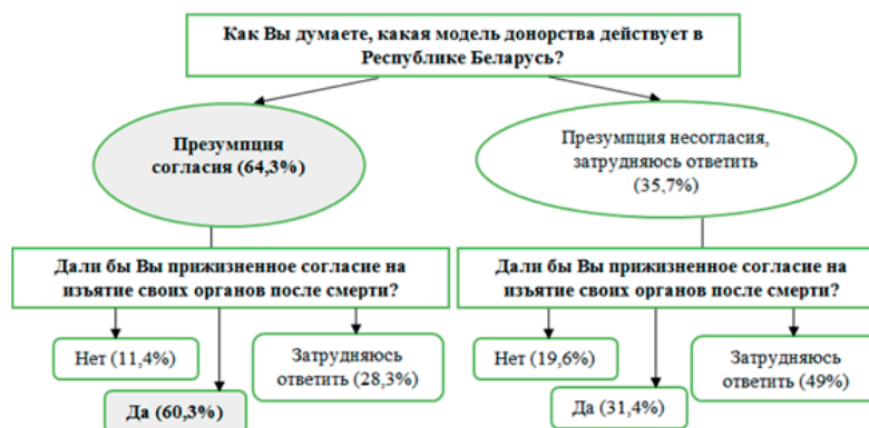
Рисунок 2. – Зависимость готовности пожертвовать органы после смерти от уровня осведомленности граждан по вопросам донорства

Диаграмма явно демонстрирует, что основной мотив у большинства людей, согласных на забор органов для трансплантации после смерти, это желание спасти кому-то жизнь, причем достоверно чаще (в 70,5% случаев) этот вариант ответа встречается в группе опрошенных, которые позитивно относятся к донорству органов и активно поддерживают развитие трансплантологии (уровень значимости p \leq 0,01 ). Данный мотив с высокой долей достоверности преобладает (59,2%) в группе респондентов, имеющих правильное представление о правовой модели донорства в Республике Беларусь (уровень значимости p \leq 0,01 ). То есть люди, имеющие позитивное отношение к донорству и ТО, а также обладающие минималь-