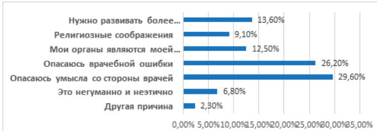
Рисунок 4. – Причины несогласия граждан на забор органов после смерти