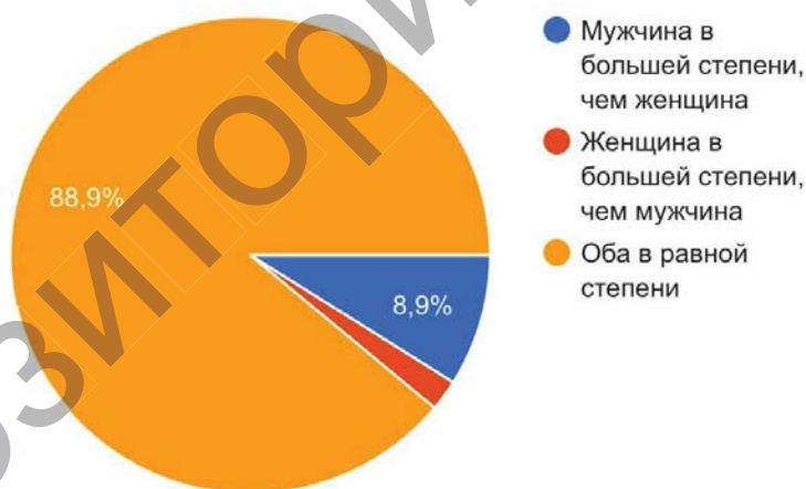
Рисунок 2. – Ответственность половых партнеров за наступление беременности и инфекций, передающихся половым путем

О том, какое количество сексуальных партнеров является допустимым, участники нашего опроса ответили следующим образом: основное количество молодежи не считает, что ограничение количества имеет какое-то значение (49,5%). 28,4% молодых людей выбрали вариант в пользу одного сексуального партнера, 20% респондентов допускает наличие сексуального опыта с 2-5 партнерами, а 2,1% студентов считает, что сексуальная связь с 5 и более половыми партнерами является нормальной.