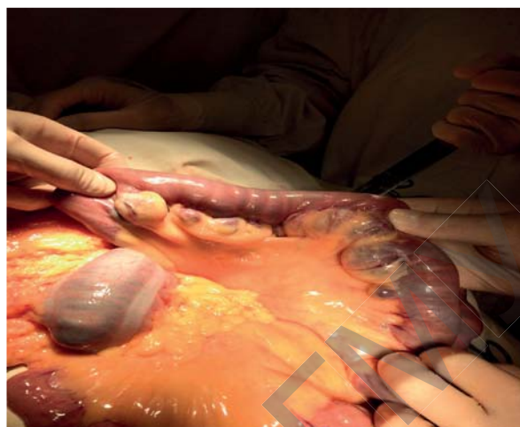
Рисунок 1. – Дивертикулез тощей кишки Figure 1. – Diverticulosis of the jejunum

протяжении 100 см, множественные дивертикулы от 0,5 до 3 см в диаметре (рис. 1).