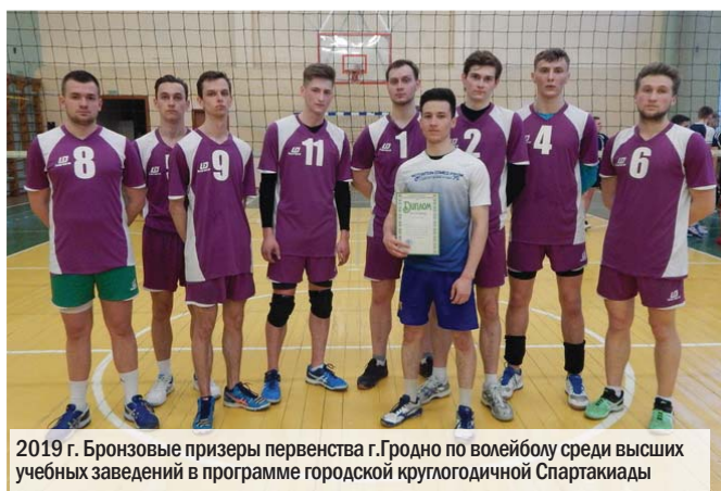
2019 г. Бронзовые призеры первенства г.Гродно по волейболу среди высших учебных заведений в программе городской круглогодичной Спартакиады