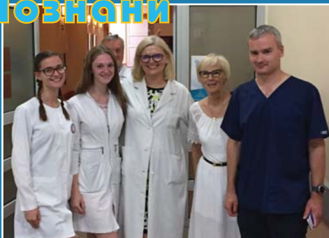
Студенты на практике в медицинском университете г. Познань

Доктор Мартин старался показать нам как можно больше. Мы видели около 30 гастро- и колоноскопий (теперь отлично знаем диффдиагностику болезни