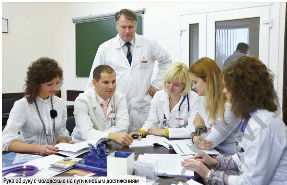
Рука об руку с молодежью на пути к новым достижениям

– всю свою жизнь я примерно в равной степени уделял время и внимание как клинической, так и научной работе. Именно это приносило и продолжает приносить истинное наслаждение от моей профессиональной деятельности.