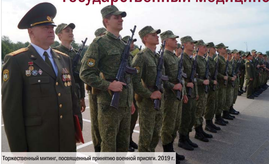
Торжественный митинг, посвященный принятию военной присяги. 2019 г.

Студентам, прошедшим полный курс обучения по программам подготовки офицеров запаса, сдавшим выпускной экзамен, завершившим обучение в учреждении образования, принесшим Военную присягу и зачисленным в запас, присваивается воинское звание «лейтенант медицинской службы запаса» в порядке, установленном законодательством Республики Беларусь.