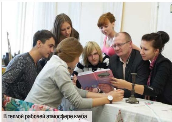
В теплой рабочей атмосфере клуба

ЖДЁМ ВСЕХ в литературном клубе! Наш электронный адрес: