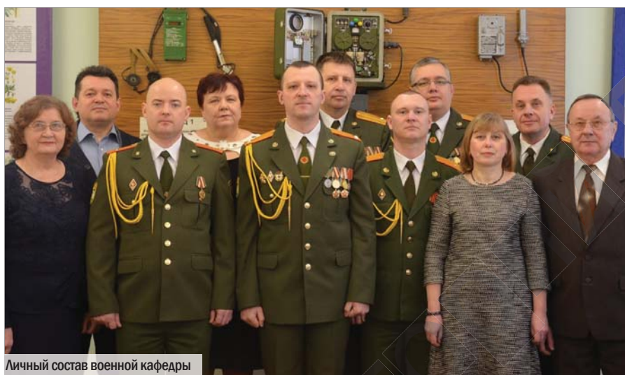
Личный состав военной кафедры

старший преподаватель военной каф. ГрГМУ подполковник медицинской службы