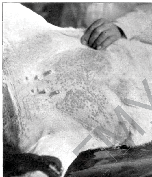
Фото 1 - Ретривакцина на коже телочки – поверхностная прививка

Если в Германии с 1 апреля 1875 года вступил в силу закон об оспопрививании, то в Российской империи такового не было, однако прививки проводились детям, поступающим в учебные заведения, новобранцам, железнодорожным служащим и ссыльным [10]. По редакционному примечанию М.Б. Блюменау [10] «28 марта 1908 года в Государственную Думу было внесено законодательное предложение об обязательном оспопрививании,