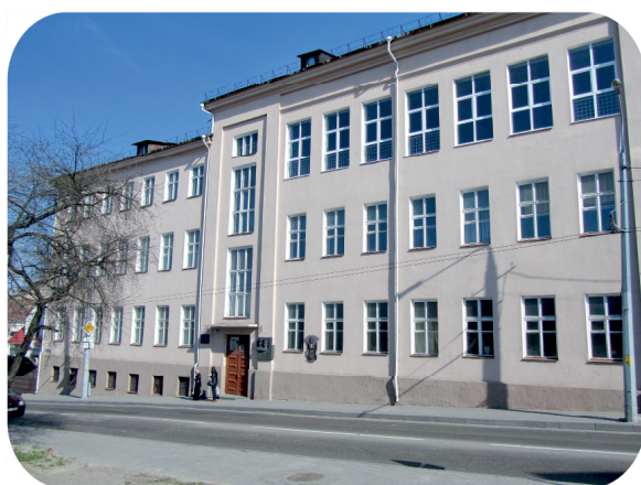
Лабораторный корпус (Б.Троицкая № 4)