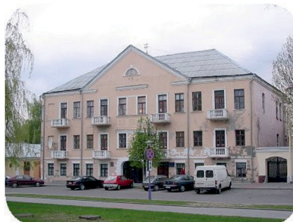
Общежитие № 1 (Замковая №5)