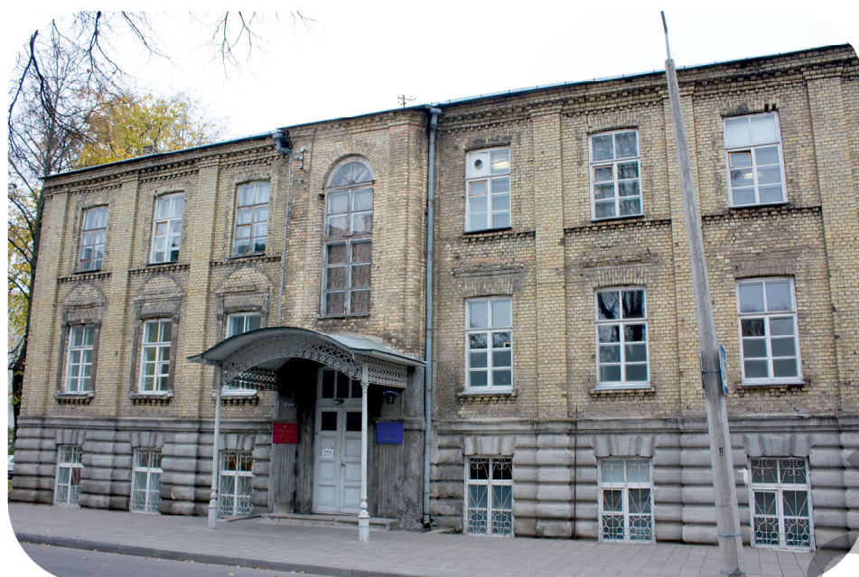
Учебный и научно-исследовательский корпус (Свердлова №3)

Пройдем по улице Замковой. Здесь расположено почти четырехвековое здание по адресу Замковая, 5, кото-