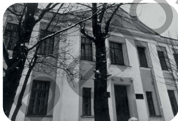
Бывший корпус университета (Антонова № 21)