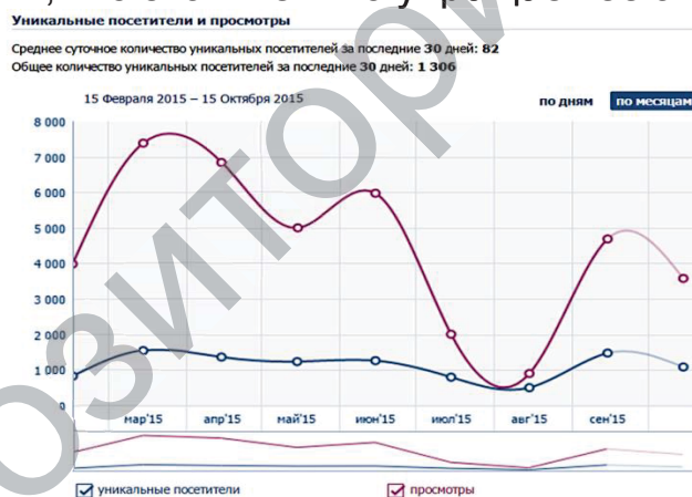
Рис. 2. Динамика количества уникальных посетителей и просмотров участниками

Сервис «В контакте» предусматривает возможность ежедневного анализа администраторами посещаемости сообщества, половозрастной структуры, территориального распределения участников, активности посетителей, количества вступивших и вышедших из группы участников, количества просмотров участниками группы видеозаписей и фотоальбомов. Информация доступна в виде графиков и диаграмм, что значительно упрощает её анализ. (Рис. 2)