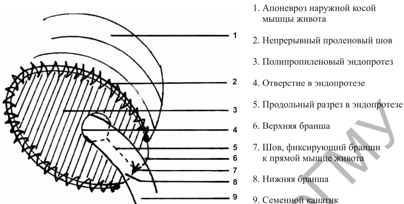
Рисунок 3 – схема комбинированной атензионной пластики пахового канала во фронтальной плоскости